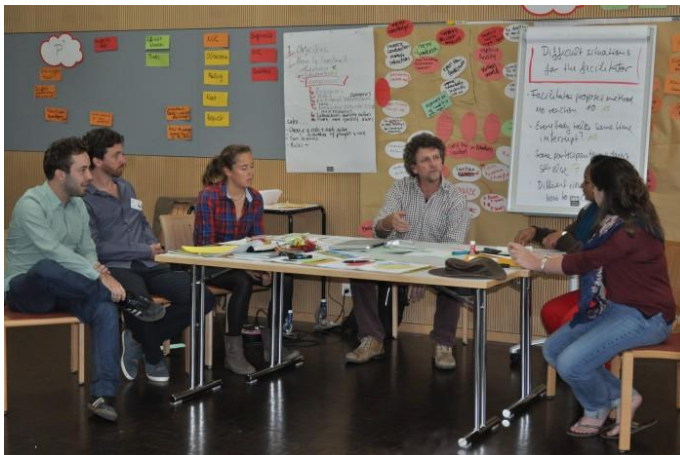
Participants à une formation de facilitation en Suisse mettant en scène une situation difficile

En conséquence, la formation utilise un large éventail de méthodes pédagogiques qui ont fait leurs preuves s'appuyant en particulier sur l'apprentissage par l'expérience : travail de groupe sur les cas des participants, simulations de situations réelles et jeux de rôle, feedback par les pairs sur ces expériences, modélisation du traitement de certaines situations par les formateurs, dialogue en plénière, ainsi que des apports théoriques et des retours d'expérience complémentaires de la part des formateurs. À la fin de la formation, vous aurez également un moment pour réfléchir à la manière dont vous pourrez utiliser les connaissances de manière novatrice dans votre propre contexte.